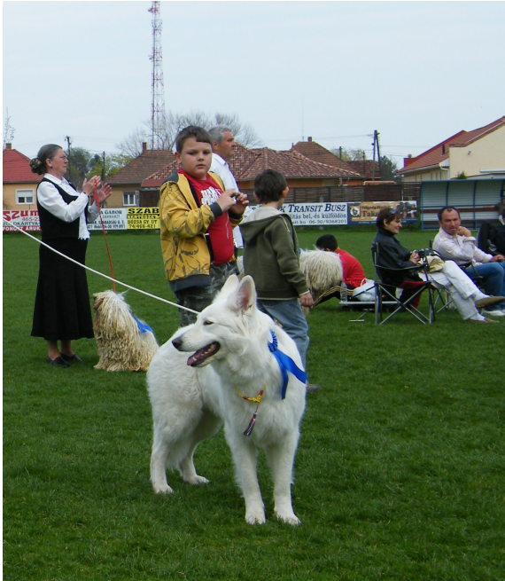
Stets verhält sie sich in 100% Fall lehrbunden kam sie auf den vierten Platz!