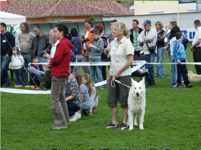
Dschinie verzaubert Richter und Zuschauer! Die Endausscheidung!