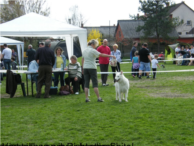
bei Slerze... Richter... Brite!